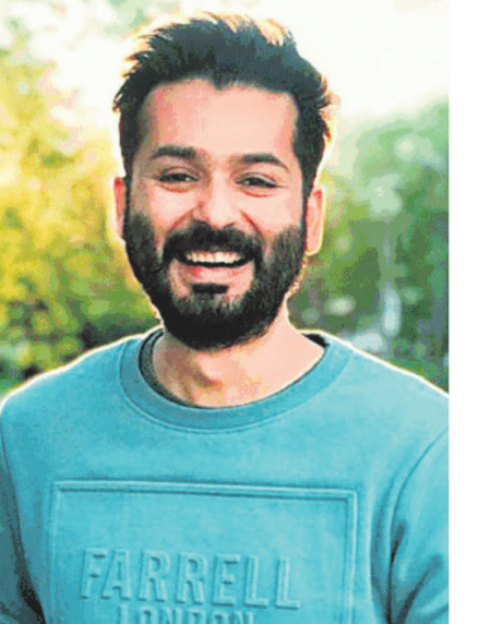
మరో ప్రతి సినిమా ఒక సాహసమే' అని పేర్కొన్నాడు.

బాలీవుడ్ స్టార్ రణవీర్ సింగ్ ప్రధాన పాత్రలో ఆదిత్యధర్ దర్శకత్వంలో తెరకెక్కిన ధురంధర్: ది రివెంజ్ విడుదలకు సిద్ధమైంది. మార్చి 19న ప్రపంచ వ్యాప్తంగా ప్రేక్షకుల ముందుకు రానుంది. ప్రస్తుతం ఈ మూవీ పనుల్లో బిజీగా ఉన్న దర్శకుడు తన పుట్టిన రోజున కూడా సినిమాకు తుది మెరుగులు దిద్దే పనిలో ఉన్నట్లు చెప్పాడు. మొదటి భాగాన్ని సూపర్ హిట్ చేసిన ప్రేక్షకులకు ధన్యవాదాలు తెలుపుతూ సోషల్ మీడియాలో పోస్ట్ పెట్టాడు. ఇన్స్టాగ్రామ్ తన పనిపై ప్రేక్షకులు చూపిన సమర్థనానికి రుణపడి ఉంటానన్నాడు. 'మీ మెస్సేజ్ లు, పోస్టులు, స్టోరీలు చూస్తుంటే నా హృదయం నిండిపోతోంది. అందరికీ పర్సనల్ గా సమాధానం చెప్పాలని ఉన్నా కుదరడం లేదు. నేను పొందే అనుభూతి మాట్లాడే చెప్పలేక పోతున్నా. నిజంగా అదృష్టవంతుడిని. గ్యారంటీ లేని ఈ చిత్రపరిశ్ర